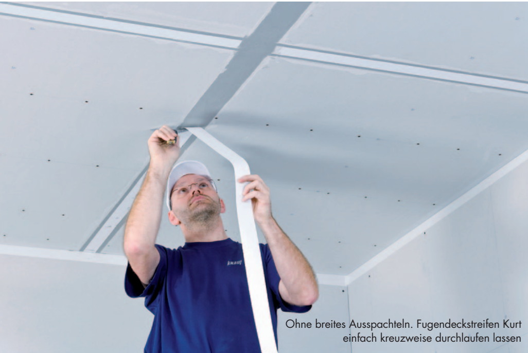
Ohne breites Ausspachteln. Fugendeckstreifen Kurt einfach kreuzweise durchlaufen lassen