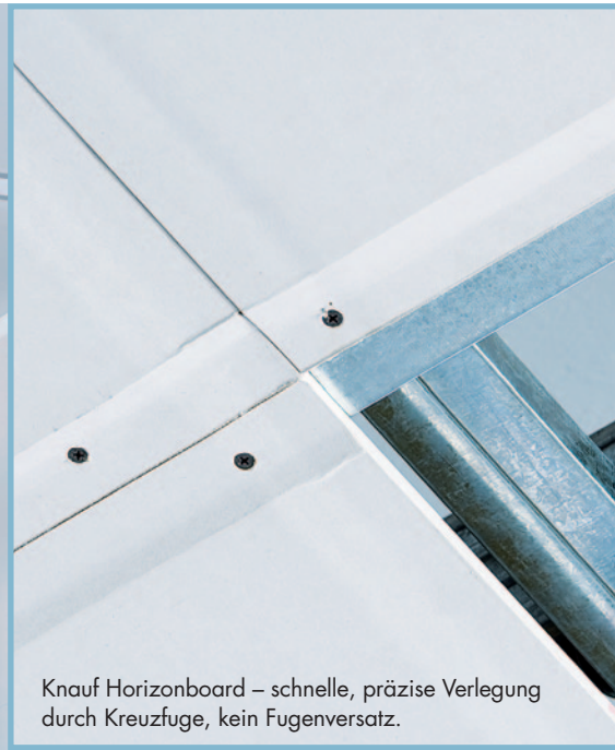
Knauf Horizonboard – schnelle, präzise Verlegung durch Kreuzfuge, kein Fugenversatz.